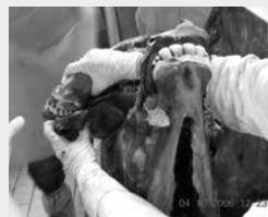
4 dentes incisivos permanentes