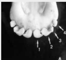
Dentes de leite