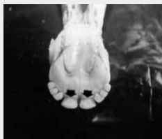
2 dentes incisivos permanentes