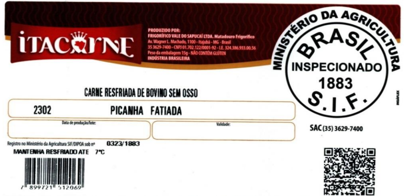
Etiqueta adesiva testeira