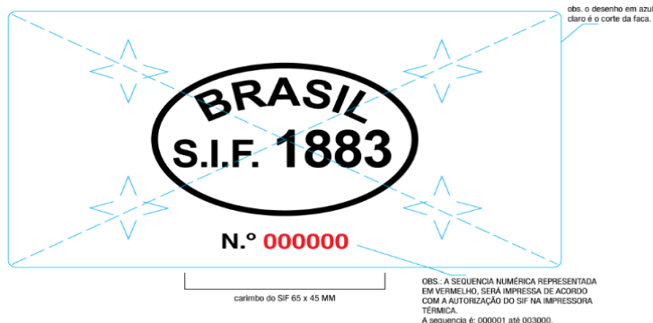
Etiqueta interna e testeira