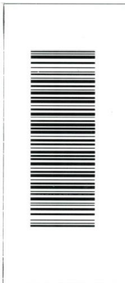
Etiqueta de contra rotulo